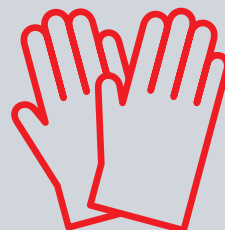
Rukavice pryžové (latexové) chirurgické v obalu