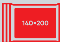
Isotermická fólie o rozměrech nejméně 200 × 140 cm