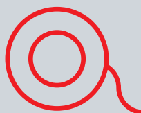
Náplast hladká cívka