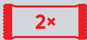
Obvaz se 2 polštářky