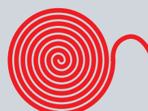
Obinadlo škrťací pryžové