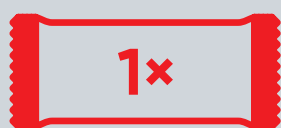
Obvaz s 1 polštářkem